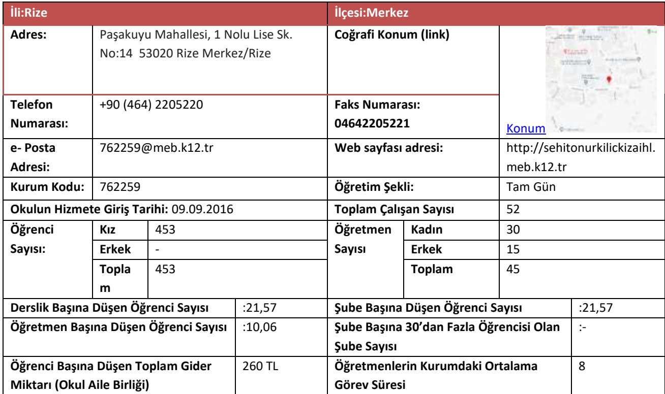
Tablo 20. Okul Künyesi