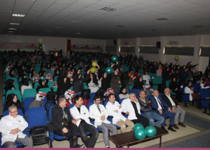
Öğretmenler Günü Kutlama Programımız