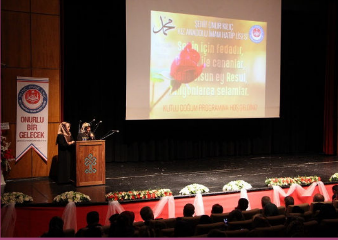
Kutlu Doğum Haftası Etkinlikleri