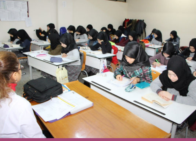
Kitap Okuma Etkinlikleri