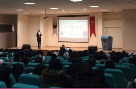
Sosyal Medya Okuryazarlığı Semineri