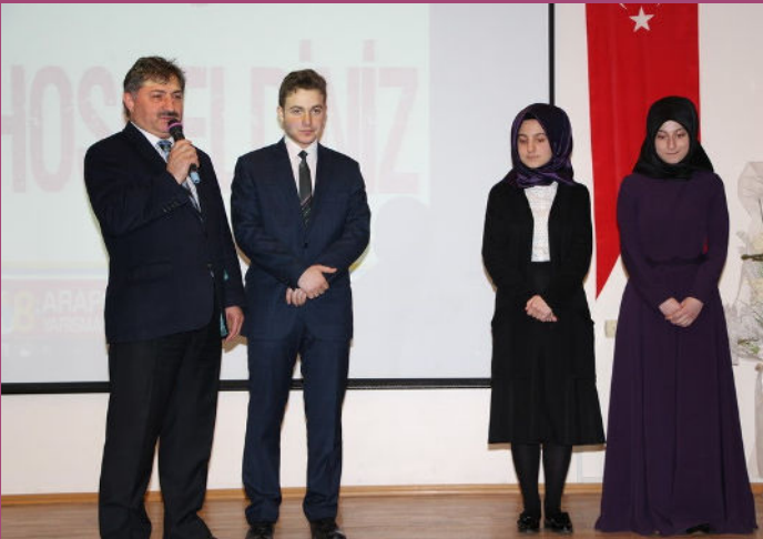
8.Uluslararası Arapça Yarışmaları