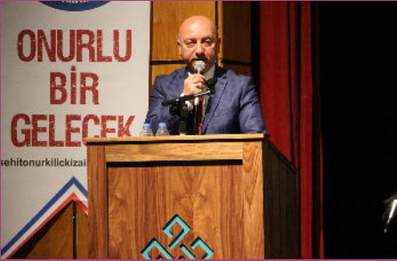
Kutlu Doğum Haftası Etkinlikleri