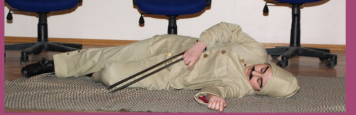
İstiklal Marşı'nın Kabulü...