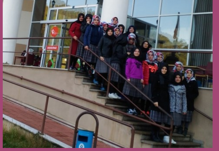
Öğrencilerimizin Fındıklı Huzurevi Ziyareti