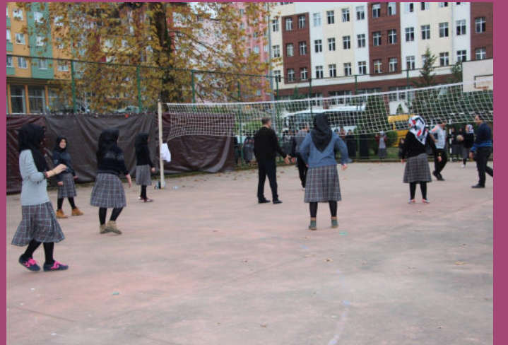
Beden Eğitimi Faaliyetlerimizden...