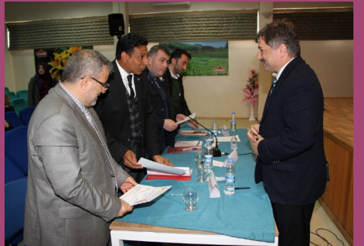
8.Uluslararası Arapça Yarışmaları