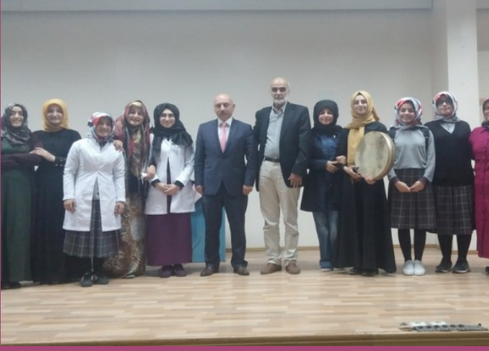
9. Sınıflar İçin Düzenlenen Hoşgeldiniz Programı