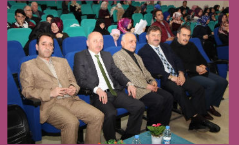
8.Uluslararası Arapça Yarışmaları