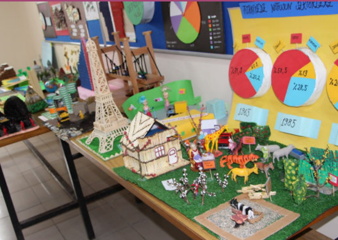
Coğrafya Dersi Öğrenci Projeleri