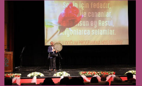
Kutlu Doğum Haftası Etkinlikleri