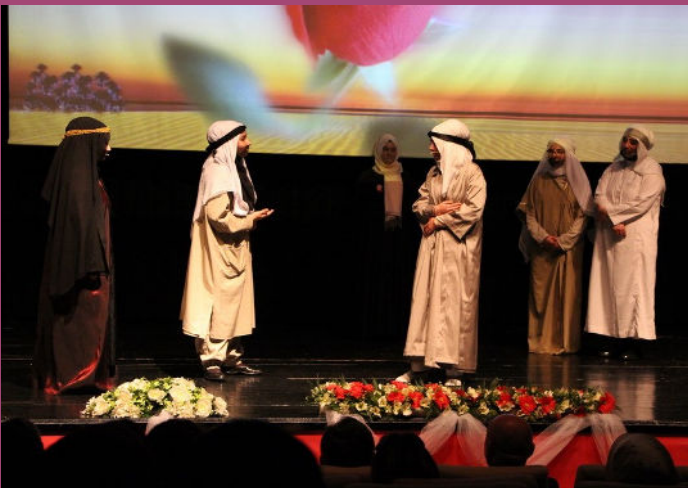
Kutlu Doğum Haftası Etkinlikleri