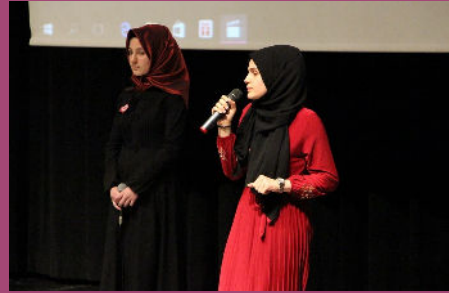
Kutlu Doğum Haftası Etkinlikleri