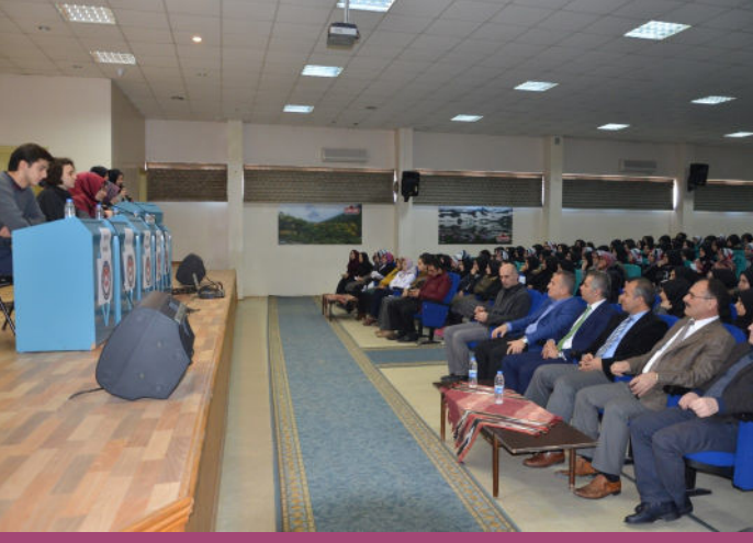
Anadolu Mektebi (Mehmet Akif'i Anma Paneli)