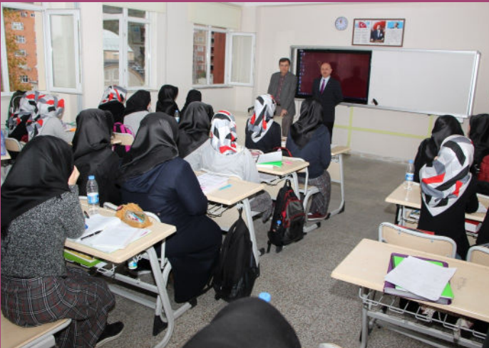
RTEÜ İlahiyat Fak. Dekanının Okulumuzu Ziyareti