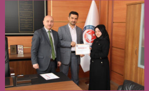
Başarılı Öğrencilerimize Belgeleri Takdim Edilirken