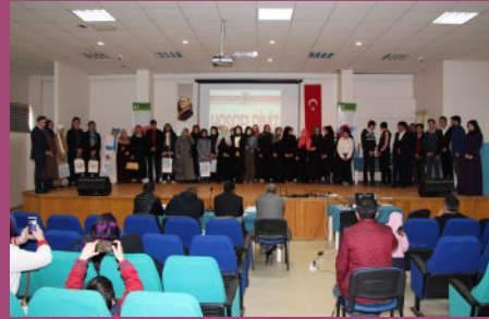
8.Uluslararası Arapça Yarışmaları