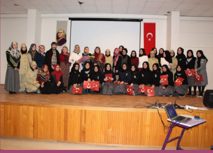
İstiklal Marşı'nın Kabulü...