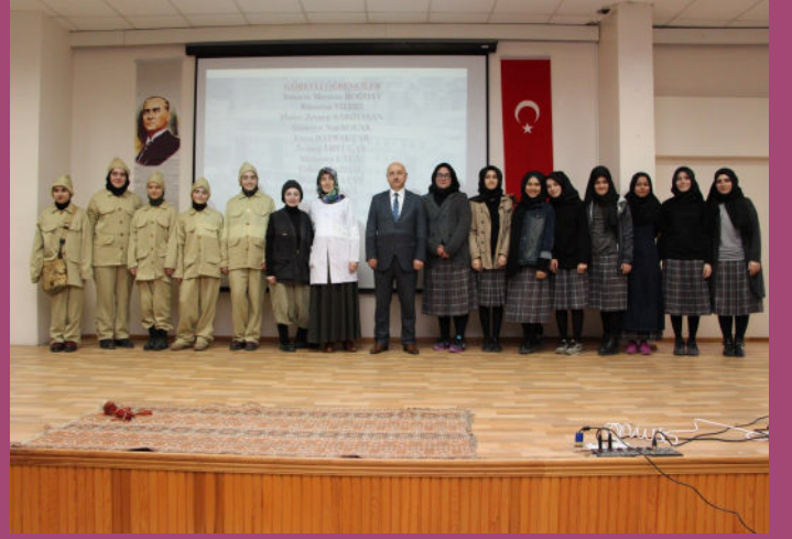
Çanakkale Zaferi Anma Programı