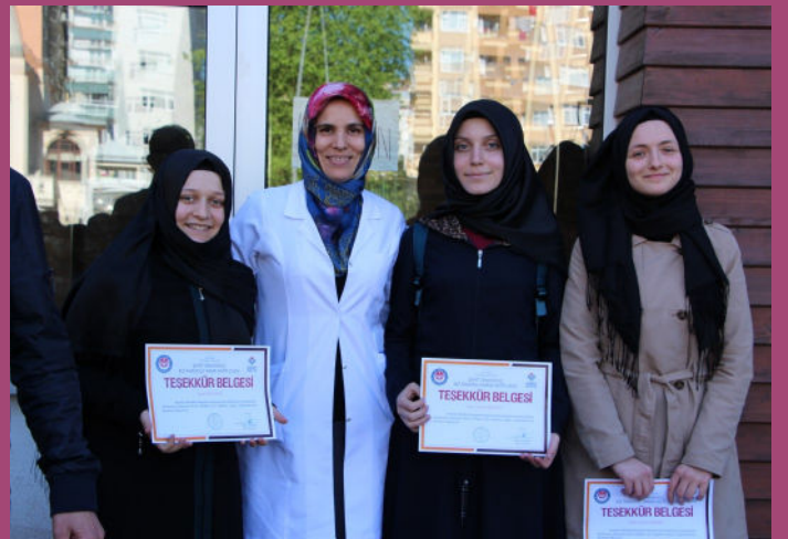
Anadolu Mektebi Konya Panelistleri