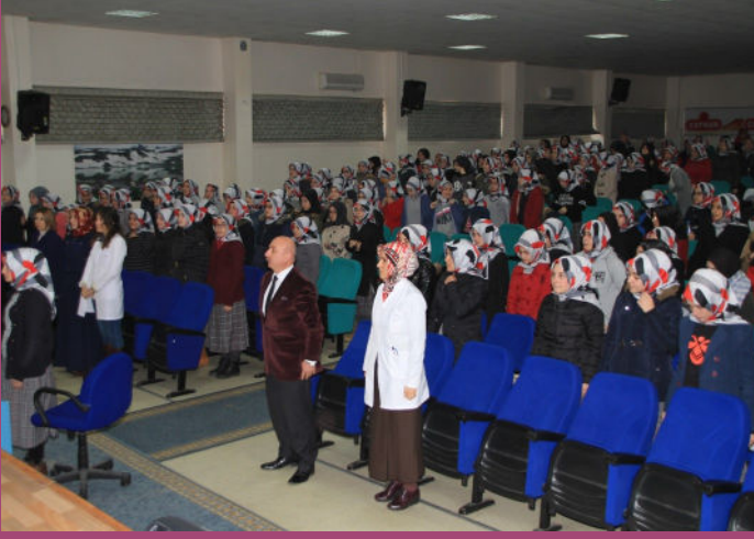
Cumhuriyet Kutlama Programı