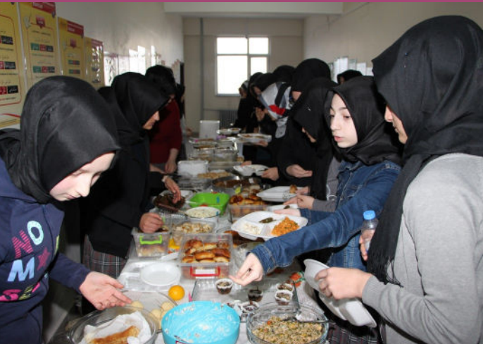
Okul Kapsamında Kermeslerimiz