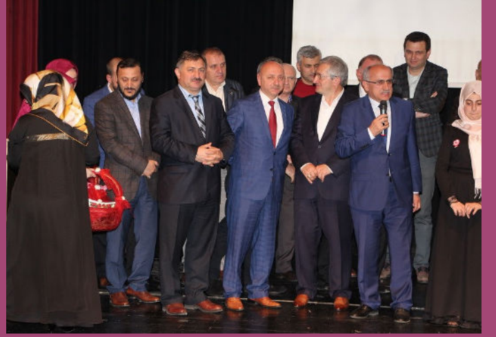
Kutlu Doğum Haftası Etkinlikleri