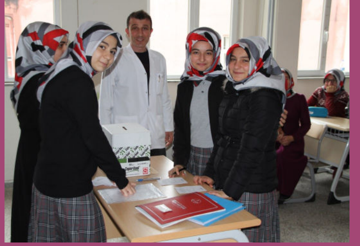
Öğrenci Meclisi Başkanlık Seçimi