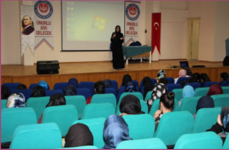
İmam Hatip Ortaokulundan Kardeşlerimizle Okulumuzu Anlattık