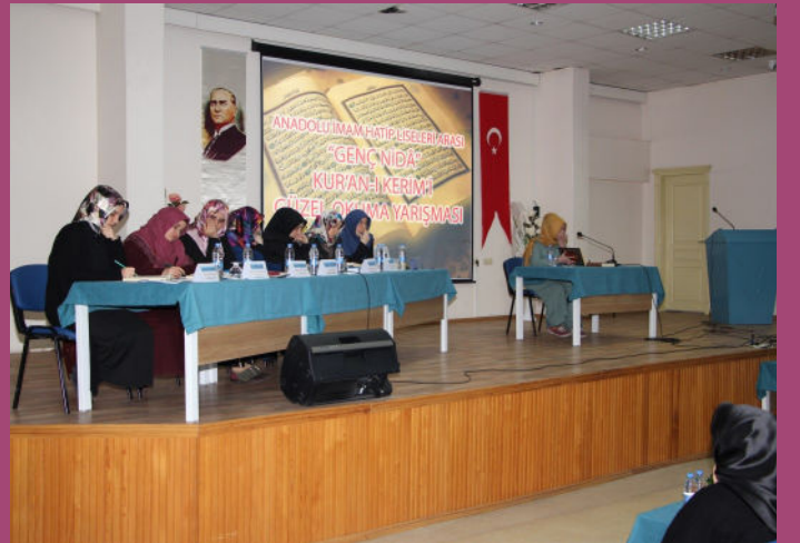
Kur'an-ı Kerim'i Güzel Okuma Yarışması