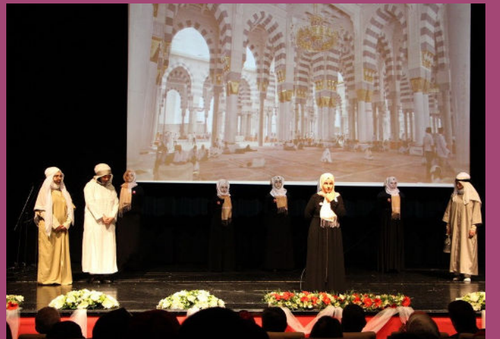
Kutlu Doğum Haftası Etkinlikleri