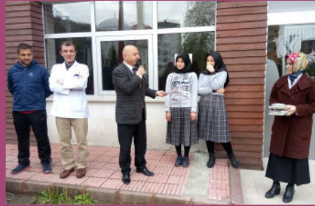
Başarılı Öğrencilerimize Belgeleri Takdim Edilirken