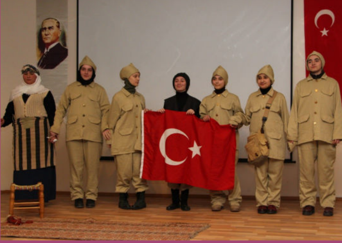
Çanakkale Zaferi Anma Programı