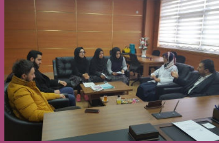
GİMDES Helal Gıda Semineri