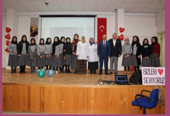
Öğretmenler Günü Kutlama Programımız