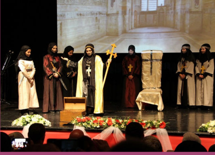
Kutlu Doğum Haftası Etkinlikleri