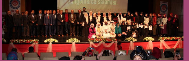
Kutlu Doğum Haftası Etkinlikleri