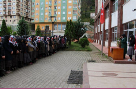
10 Kasım Anma Programı