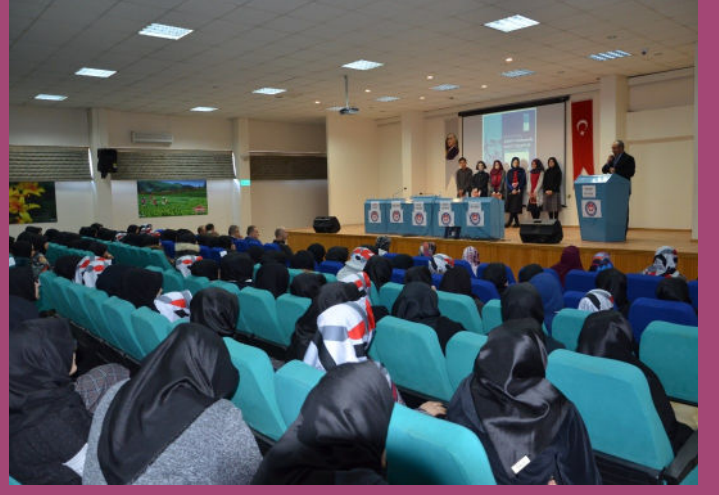
Anadolu Mektebi (Mehmet Akif'i Anma Paneli)